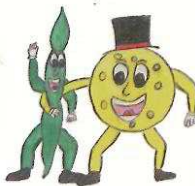
Disegno originale dell'Autore Alex Giuliani

Tutti i disegni hanno messo in evidenza la grande fantasia dei ragazzi e la loro freschezza. La Qualità non è venuta meno e per questo li ringraziamo tutti per aver dato un contributo straordinario e genuino a questa Festa.